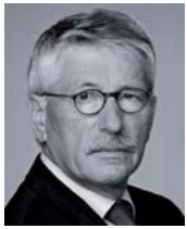
Dr. Thilo Sarrazin Mitglied des Vorstands der Deutschen Bundesbank

1945 geboren 12. Februar in Gera, verheiratet, 2 Kinder 1967 – 1971 VFL Studium Bonn mit Abschluss Dipl. Volkswirt 1975 – 1991 Bundesministerium der Finanzen & Bundesministerium für Arbeit und Sozialordnung 1991 – 1997 Staatssekretär Finanzen, Rheinland-Pfalz 1997 – 2000 Vorsitzender der Geschäftsführung der TLG Treuhandliegenschaftsgesellschaft mbH, Berlin 2000 – 2000 Leiter der Konzernrevision bei der Deutsche Bahn AG 2000 – 2001 Mitglied des Vorstands der DB Netz AG 2002 – 2009 Senator für Finanzen des Landes Berlin seit 2009 Mitglied des Vorstandes der Deutschen Bundesbank